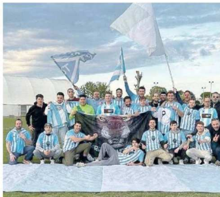
PROMOSSI I festeggiamenti dello Stra Riviera del Brenta