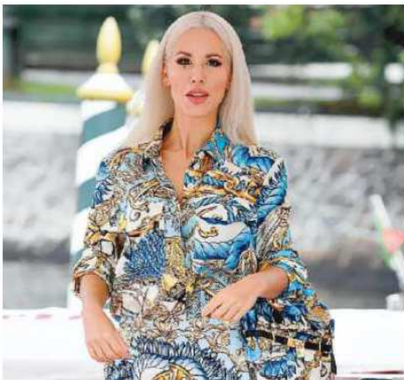
Baby K al Lido di Venezia, durante la Mostra del Cinema 2020

que la kermesse partecipando alla serata inaugurale del 30 giugno, grazie a Radio WoW, confermando in questo modo il tenore di un'edizione tutta da ballare (biglietti su TicketOne e Ticketmaster da lunedì 17 aprile). Una programmazione che prende sempre più forma ma Paolo Favaretto annuncia anche che, accanto ai grandi concerti, l'organizzazione ha deciso di plasmare un festival sempre più sostenibile. «Cirendiamo conto», afferma il patron, «che un mese di musica, grandi numeri e grande pubblico, possa anche incontrare qualche resistenza: per questo abbiamo deciso di "spegnere" la musica tutti i lunedì (il 3, 10, 17 e 24 luglio), perché il Mirano Summer Festival è in città e per la città». —